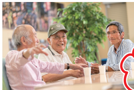
元気だから 笑顔が自然に あふれてくる