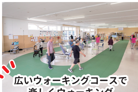
広いウォーキングコースで 楽しくウォーキング

富山市大沢野地区でリハビリ特化型デイサービス (定員 45名)として運営中。その2号店となります。