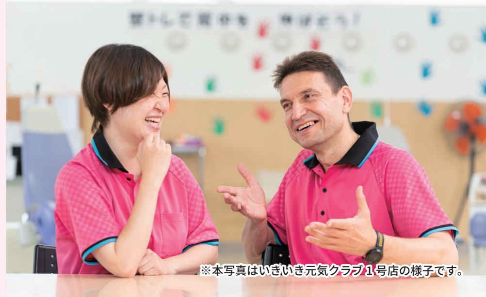
※本写真はいきいき元気クラブ1号店の様子です。